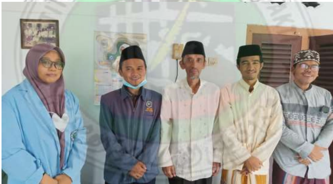
Wawancara dengan tokoh masyarakat