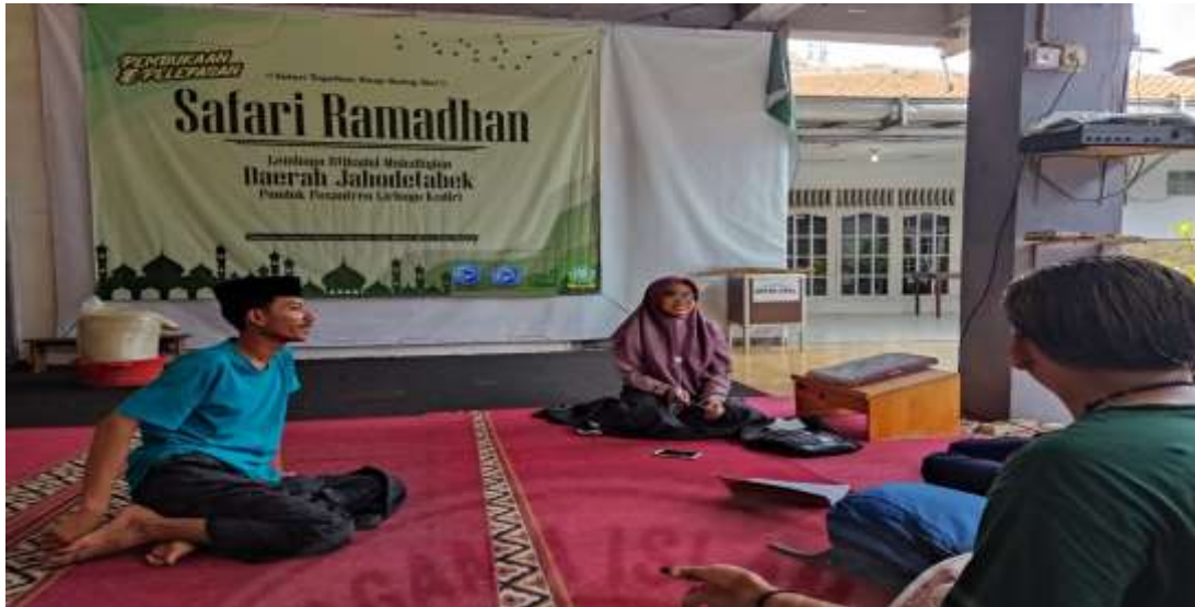
4. Wawancara dengan panitia safari